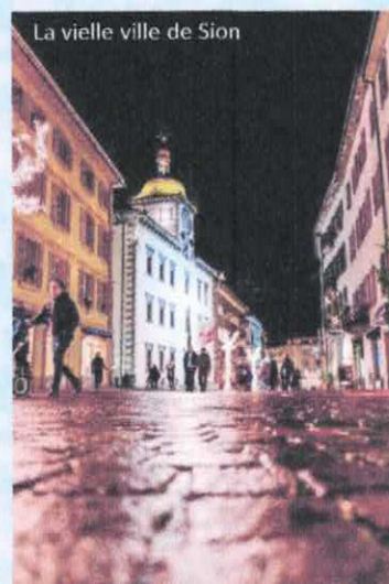
La vieille ville de Sion

Inscriptions à partir du 15 janvier 2026 (voir contrat de vente)