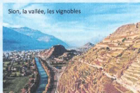
Sion, la vallée, les vignobles

Sion est située au bord du Rhône. Le centre-ville ne se trouve pas dans la partie la plus basse de la vallée du Rhône, mais légèrement plus haut, sur le versant nord. Aujourd'hui,